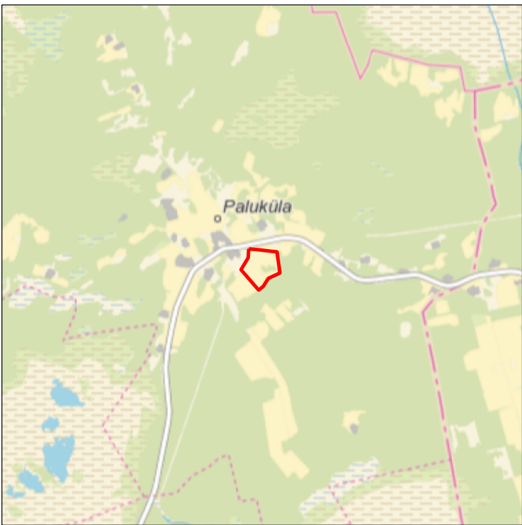
Kaardileht nr 6323 Kaiu